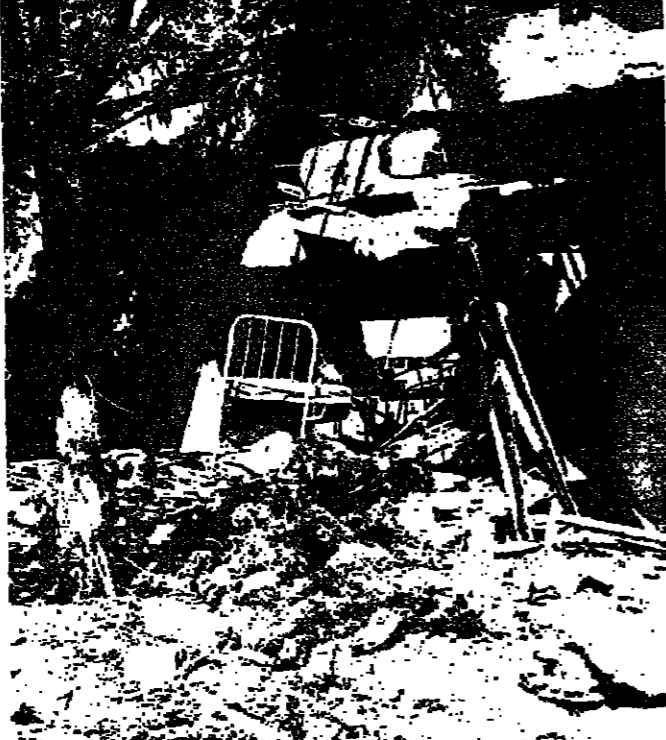
نادي الضباط في صور بعد اصابته بالذخائر الاسرائيلية

بعد الظهر : وجاء في بيان «وفا» عن عدوان تعرضت منطقة صور في جنوب لبنان لعدوان جوي صهيوني وحشي استهدف الاجزاء السكنية وبيوت المدنيين . فقد هاجم طيران العدو في الساعة الواحدة ظهر اليوم عدداً من المناطق في قضاء صور . وركزت قصف الطيران على منطقة البرغلة اذ نصف ساعة . وتصدت قوات ميليشيا الثورة وقوات المقاومة الشعبية لطائرات العدو الغيرة ببساطة وشجاعة . ونابع البيان : وتشير المعلومات الاولية الى تدمير ٥٥ منزلاً واصابة عدد كبير من المدنيين باصابات مختلفة نتيجة القصف . ويستعدو «وكالة الانباء الفلسطينية» براسالي الصحف ووكالات الاباء لزيارة الأماكن التي تعرضت لعدوان . من جهة ثانية تعرض خراج قريسة راية - عين الشب - الشهيرة ، لقصف مدفعي الساعة الخامسة صباح امس ، استمر حتى السادسة . وفي السادسة والنصف وسع الاسرائيليون تصميمهم ليشعل خراج الجبسية - حلتا - المحيرجات . كما تجدد القصف في ساعات الظهيرة لضواحي شعبا . ونجح عنه ضرر بالزروعات .